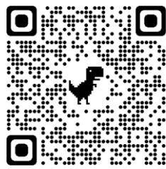
Jacob Collier ft. Mahalia: All I Need