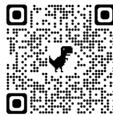
THE GOVT. KNOWS - KNOWER (erősen NSFW)