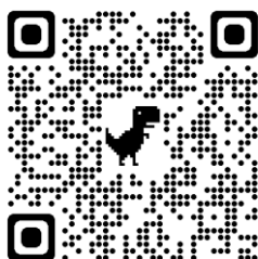
Vulfpeck feat. Louis Cole - It Gets Funkier IV

És hogy mi fogja össze ezt a három együttest/zenészt? Két dolog: a hallgatóságuk, és a nem zenei tartalmaik minősége. Az elsőre bizonyíték a már többször említett honlap, ezt még egyszer ajánlom böngészésre, a másodikat pedig mindenki eldöntheti magának, csak nehogy a tanulás rovására menjen a sok YouTube.