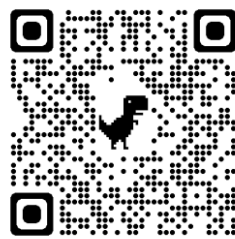
F it up - Louis Cole (Live Sesh)