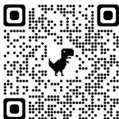
Jacob Collier: Tiny Desk (Home) Concert